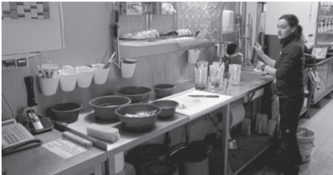
Das Foto zeigt Nicole Pekruhl aus dem Multimar-Aquaristik-Team bei der Arbeit hinter den Kulissen.

Wie alle anderen Einrichtungen in der Nationalparkregion und ganz Schleswig-Holstein, ist auch das Nationalpark-Zentrum Multimar Wattforum geschlossen. Und doch geht es drinnen ausgesprochen lebendig zu.