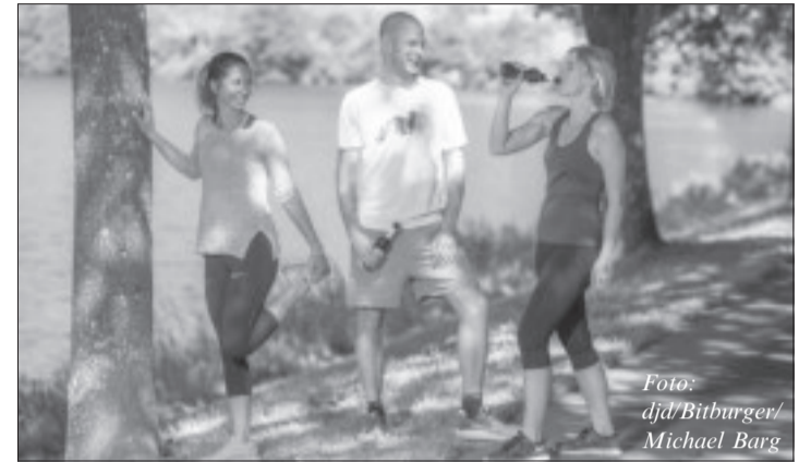
Ein alkoholfreies, isotonisches Bier ist bei Profis ebenso wie bei Freizeitsportlern nach dem Training beliebt.

die richtige Regeneration. Dazu gehört es, direkt nach dem Sport Mineralien- und Flüssigkeitsspeicher wieder aufzufüllen. Das alkoholfreie, isotonische Bitburger 0,0% ist dazu bei Profis ebenso beliebt wie bei Freizeitsportlern.