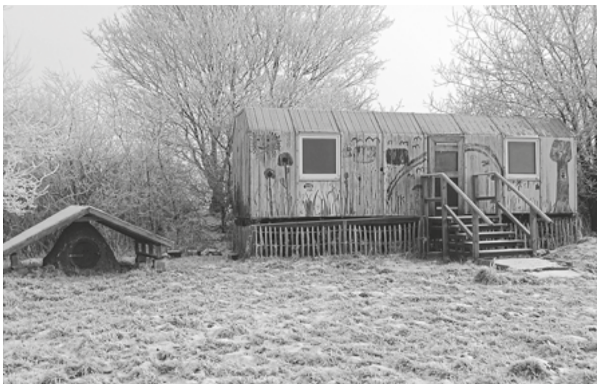
Wintermärchen im Januar.

Nachdem in den ersten Jahren kaum Interesse an den Früchten der Obstwiese bestand, hat sich die Situation in den letzten Jahren leider dahingehend entwickelt, dass einzelne Bürger*innen sich zumeist frühzeitig größere Mengen aneignen, ohne auf die Pflückreife zu achten, die auf den kleinen Schildern vermerkt ist; und dabei teilweise auch noch durch Herunterreißen der