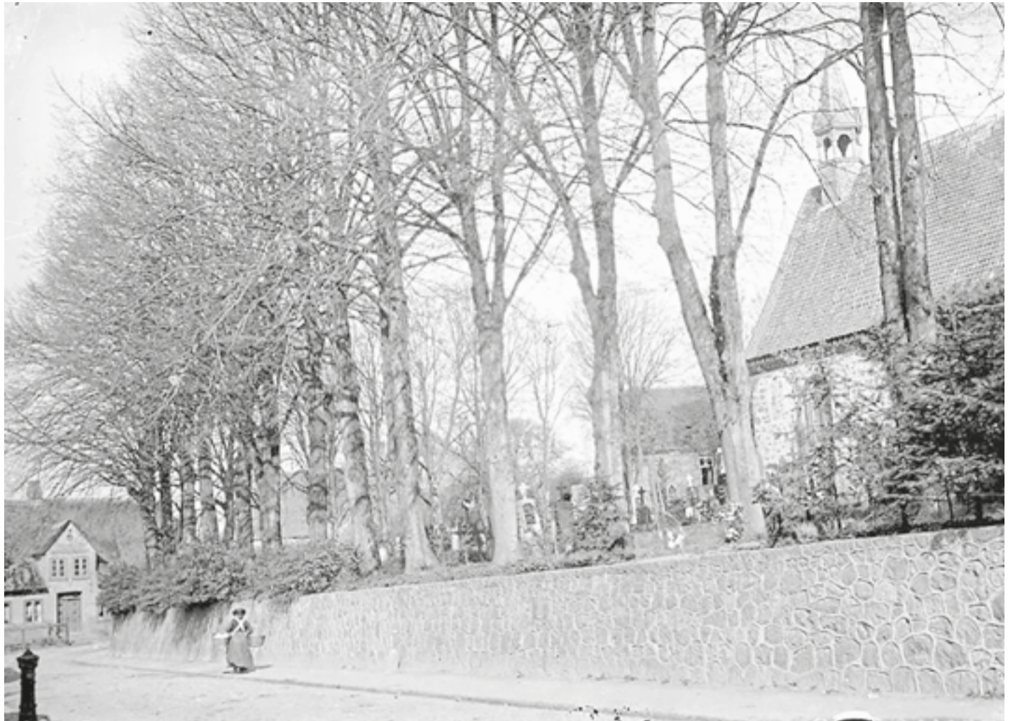
Schwabstedt aus der Zeit um 1900. Die alte Mauer zum Friedhof sowie die historische Kirche aus dem Jahrhundert 1200 sind bis heute unverändert und sofort wiederzuerkennen. Schwabstedt bietet diverse Gebäude und Orte, deren Charakter seit mindestens 100 Jahren gewahrt wurde, was den Charme des Dorfes auszeichnet.