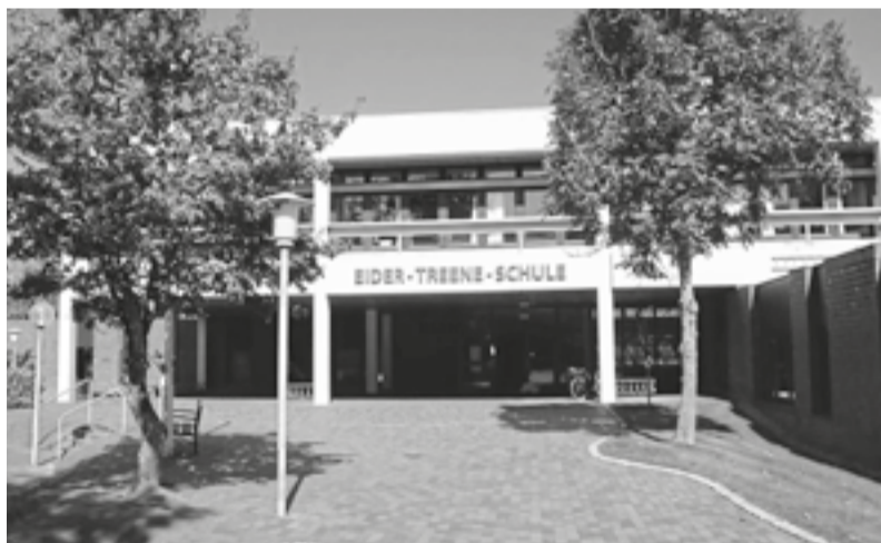
Die Eider-Treene-Schule freut sich auf ein Kennenlernen.

Alle interessierten Familien sind sehr herzlich eingeladen,