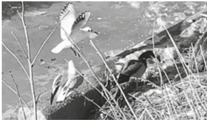
Foto links: Ein Stelldichein bei sonnigem Winterwetter. Aufgenommen in Friedrichstadt beim Holmer Tor. Foto rechts: Letzte Woche bei minus 5 Grad am Dockkoog, Husum. Badeverbot, auch für die ganz Mutigen.