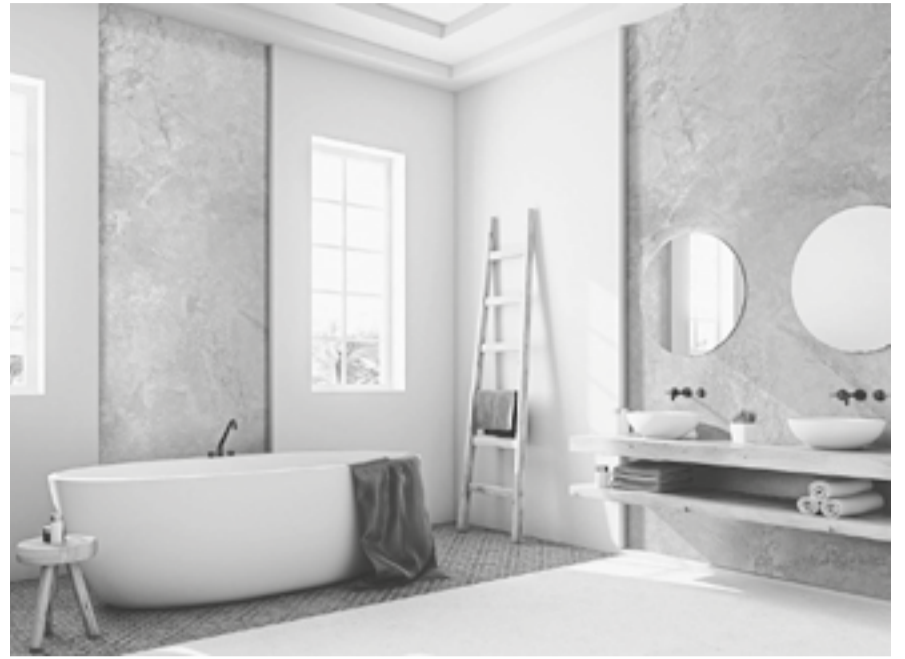
In diesem Badezimmer wird ein helles Steindekor mit farbigen Bodenfliesen und moderner Keramik kombiniert.

Bei der richtigen Umsetzung helfen zudem Montagevideos auf dem YouTube-Channel des Anbieters. Vom Vorbereiten bis zum Befestigen und Verfügen der Aluverbundplatten werden alle Arbeitsschritte anschaulich dargestellt. In Praxisbeispielen wird unter anderem der Einsatz der Platten bei einem Sanierungsfall sowie bei einem Neubauprojekt gezeigt.