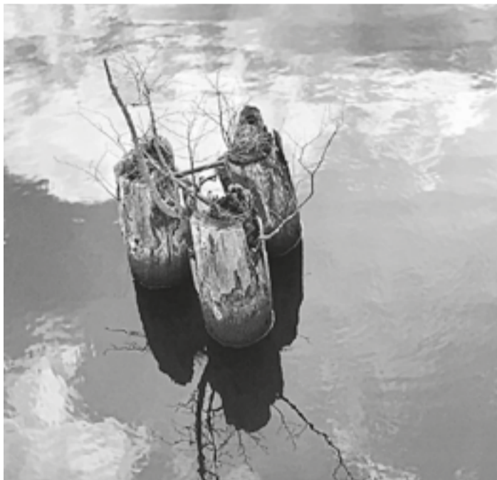
Bei strahlendem Sonnenschein eine Aufnahme von Baumstümpfen in der Eider, die sich im Fluss spiegeln.