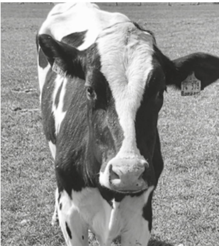
Ich beobachtete sie eine Weile, die Kuh, die frass ganz ohne Eile, schaute mir beim Laufen zu, zum Abschied gabs ein mehrfach Muh.