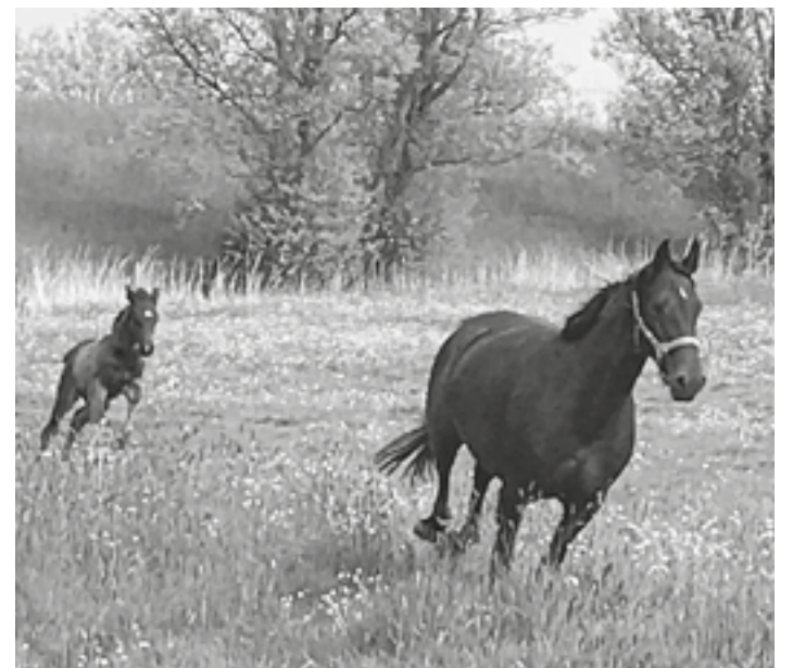
Der Sinn des Lebens sichtbar: Glück.