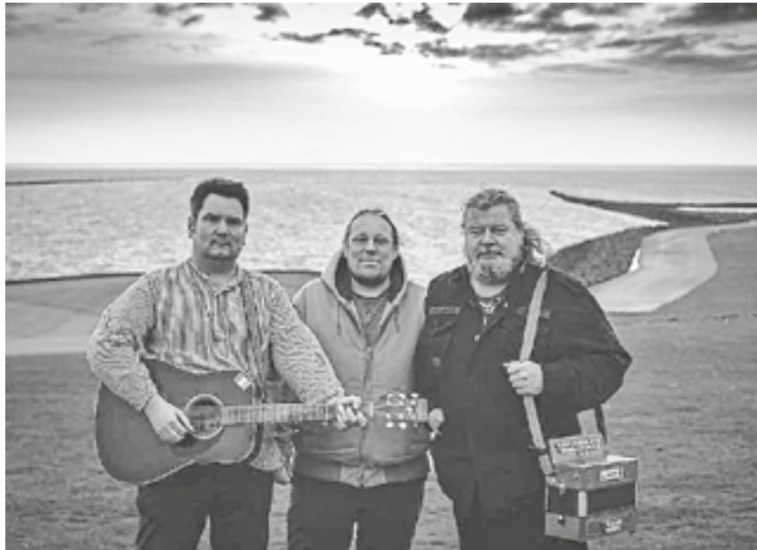
Das Trio „Guinness & Beugelbuddelbeer“.