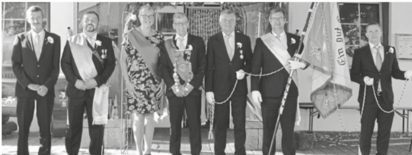
Die neuen Würdenträger.

Nach 2 Jahren Pandemiepause hieß es im Schützenheim wieder „Gut Schuss“ für die Gildeschwestern und die Gildebrüder. Am 19. August wurden die ersten beiden Durchgänge geschossen. Geschossen wurde mit dem Luftgewehr auf die 10er Ringscheibe.