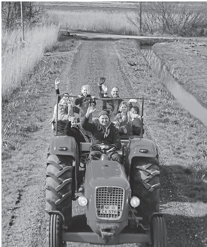
Der Spaß war den Teilnehmern beim Arbeitseinsatz und Frühjahrsputz anzusehen: mit dem Trecker ging es zu den Sammelstellen.

Nach getaner Arbeit gab es eine Stärkung in Form von Stov-Kartoffeln mit Frikadel-