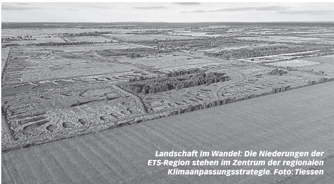
Landschaft im Wandel: Die Niederungen der ETS-Region stehen im Zentrum der regionalen Klimaanpassungsstrategie.

Daten zum Förderprojekt im Überblick: Projekttitle: Klimakoordinator/in für die ETS-Region, Projektträger: Eider-Treene-Sorge GmbH, Ge-