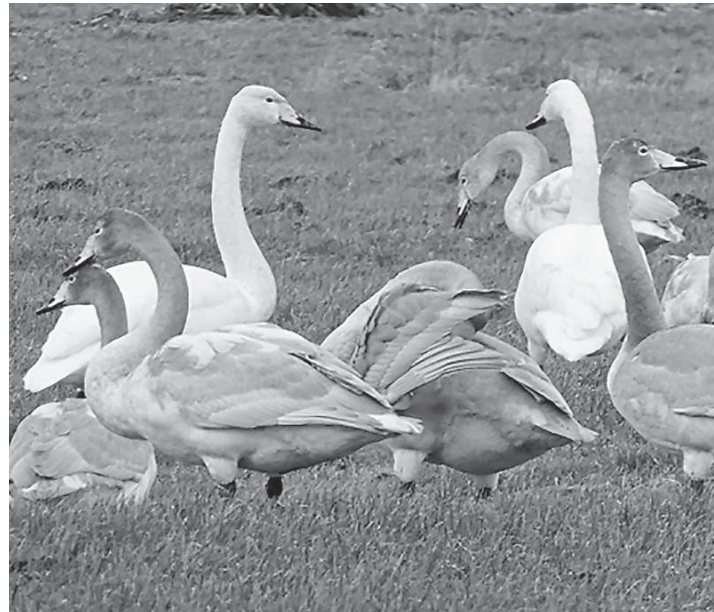
Singschwäne mit Nachwuchs.

Neben den Schwänen werden wir unser Augenmerk auch auf andere Wintergäste richten. Wir dürfen gespannt sein!