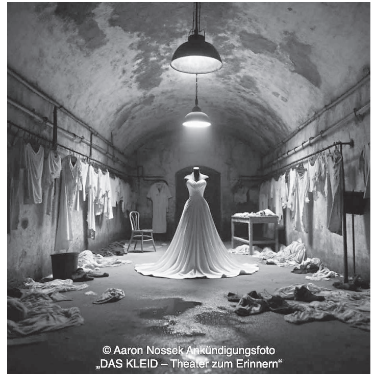
Ankündigungsfoto „DAS KLEID – Theater zum Erinnern“