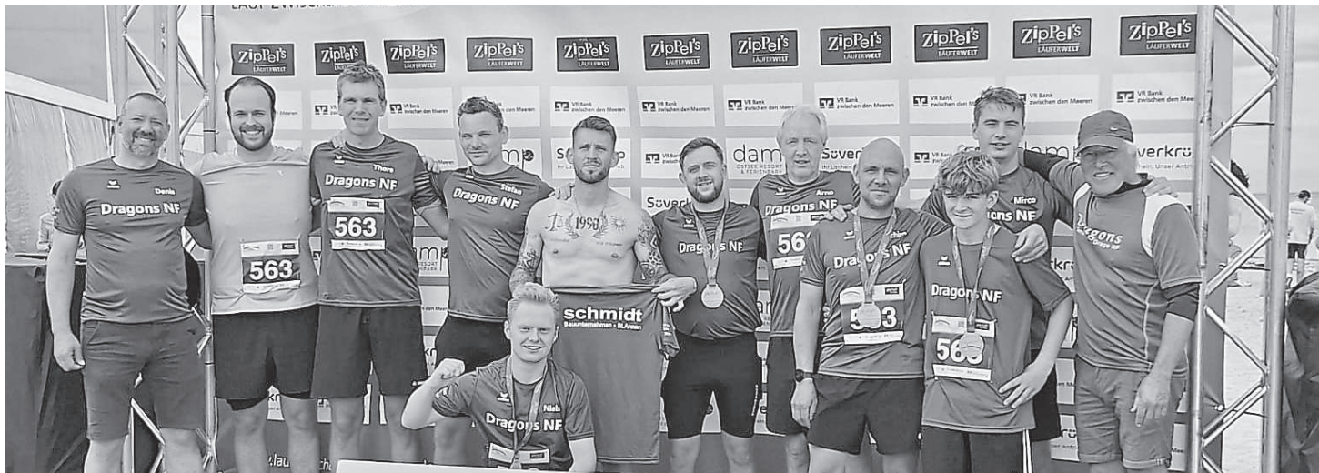
Die Dragons 2026 mit Support-Crew nach dem Zieleinlauf in Damp.

Am Samstag, 30. Mai, war es wieder soweit. Die Dragons der Gemeinde Drage standen mit rund 700 anderen Mannschaften an der Startlinie in Husum, um das Land beim „Lauf zwischen den Meeren“ von der Nordsee zur Ostsee im Dauerlauf zu durchqueren.