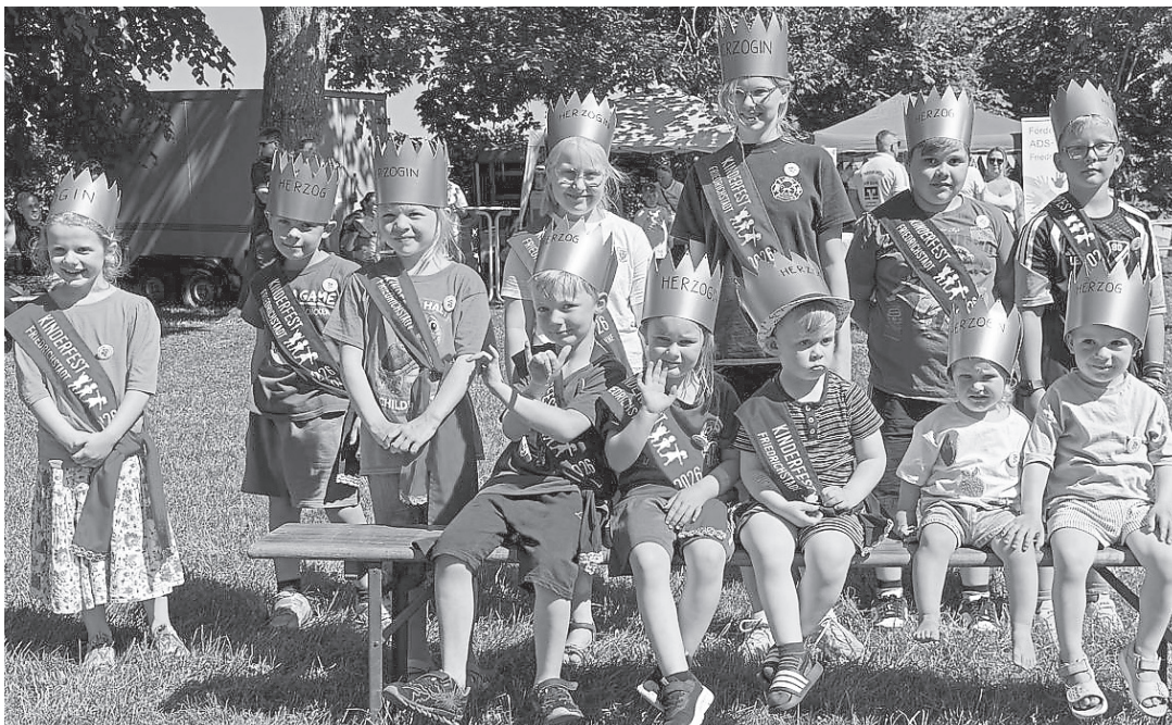
Unser Foto zeigt die Herzoginnen und Herzöge des Jahres 2026.

Die von zahlreichen freiwilligen Helferinnen und Helfern aus Friedrichstadt betreuten Gruppen machten sich anschließend bei bestem Wetter auf den Weg zu den einzelnen Spielstationen. Dort maßen sich die Kinder miteinander, hatten jede Menge Spaß und feierten sich gegenseitig an – ganz nach dem Motto: „Gemeinsam macht es mehr Spaß.“