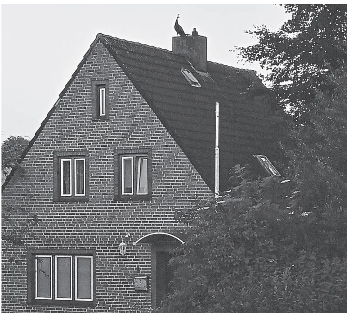
Am Abend des 23. Juni war auf dem Dach eines Hauses in Friedrichstadt ein unbekannter Vogel zu sehen. Sicher ein seltener Anblick in dieser Region.